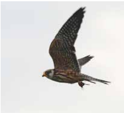
Vogel in de lucht

Ga lekker naar buiten en zoek alle onderdelen. Wie heeft als eerste bingo?