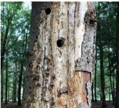
Gat in boom (door vogel gemaakt)