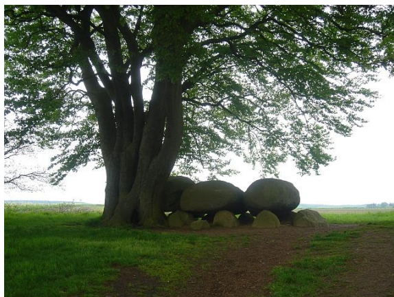
Hunebed D21 bij de Zuideresch