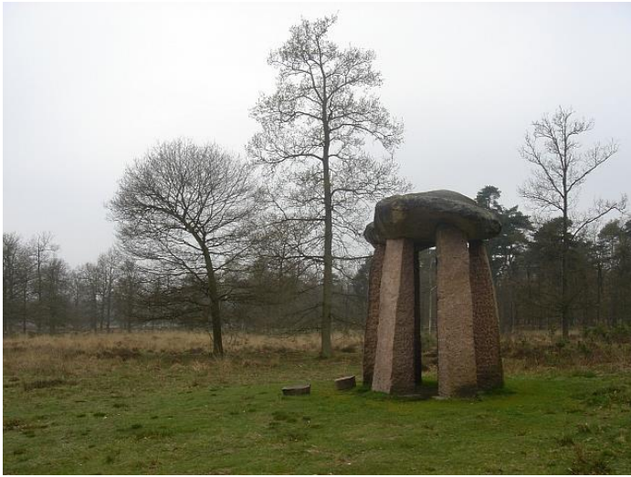
'Ode aan de zon' in het Schapenpark

Even linksaf ziet u bij de kerktoren van Odoorn dat men in de middeleeuwen zwerfkeien gebruikte om het metselwerk een stevige basis te verschaffen.