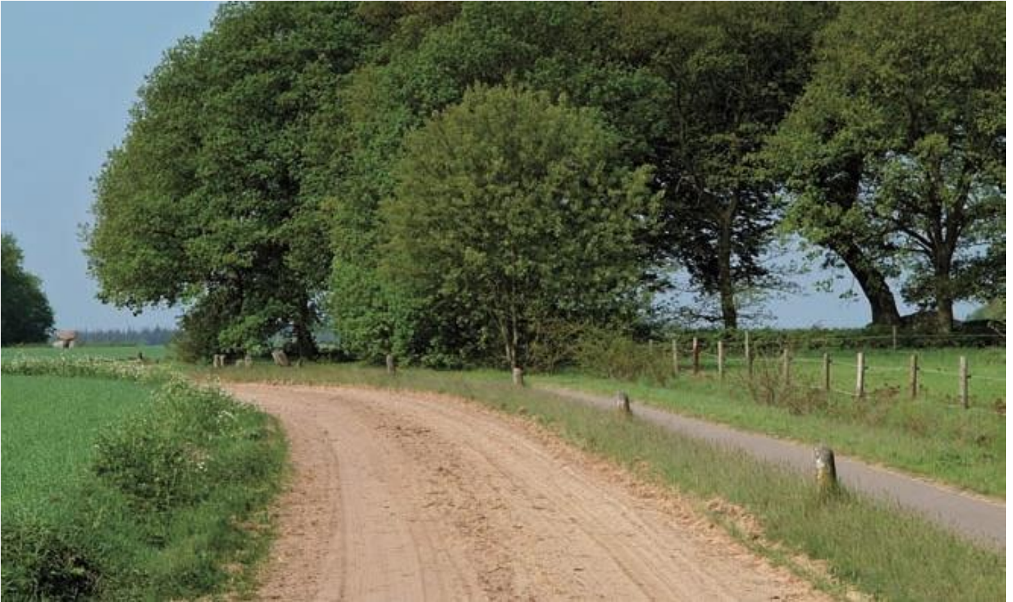
Fietspad Bronneger

Mocht het predicaat 'een fietstocht vol afwisseling' ooit ergens terecht opgeplakt zijn, dan is het wel op deze route vanuit Borger langs de oude dorpen Bronneger, Drouwen, Gasselte, Buinen, Exloo en Odoorn. Onderweg heeft u prachtige vergezichten over het beekdal van de Hunze en zijn bronriviertjes het Voorste en Achterste Diep. U ziet de Hondsrug als een glooiende lijn langs de westelijke horizon en vanaf de uitkijktoren Poolshoogte bekijkt u de Staatsbossen eens vanaf een geheel andere kant. U komt over hoge essen, over de heide, door het bos. U fietst langs aardappelakkers waar geen eind aan lijkt te komen. Onderweg rijdt u langs kleine weilandjes, afgelegen boerderijen, stille dorpjes en bedrijvige dorpscentra. Plus dat de tocht u vandaag langs maar liefst éénvijfde deel van de Drentse hunebedden voert!