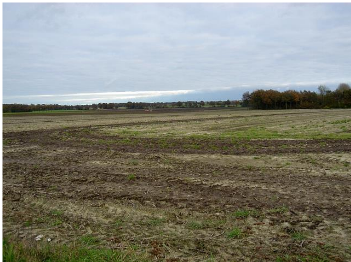
Over de flanken van de Hondsrug