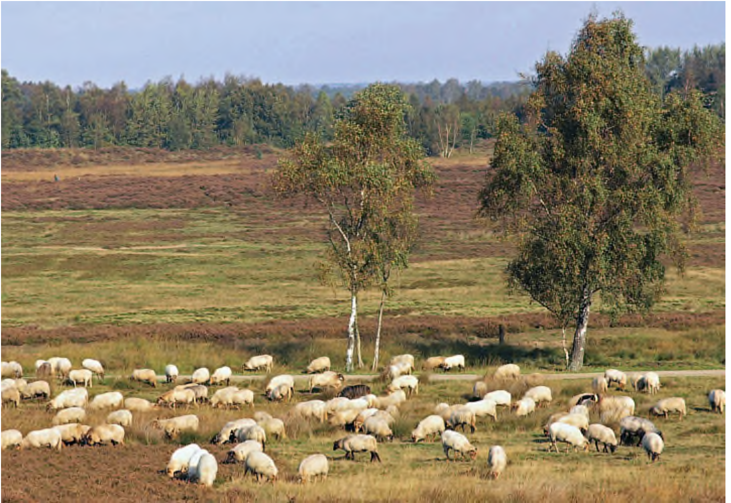
Uitzicht Havelterberg

De Havelterberg een berg noemen is natuurlijk een beetje overdreven. Hij meet 18,8 meter boven NAP. Kom daar maar 'ns mee aan in het buitenland... Als je echter bij de Havelter hunebedden staat en je ziet die flinke bult in het landschap, dan ben je op z'n minst blij dat de top van de Havelterberg niet in de fietsroute opgenomen is.