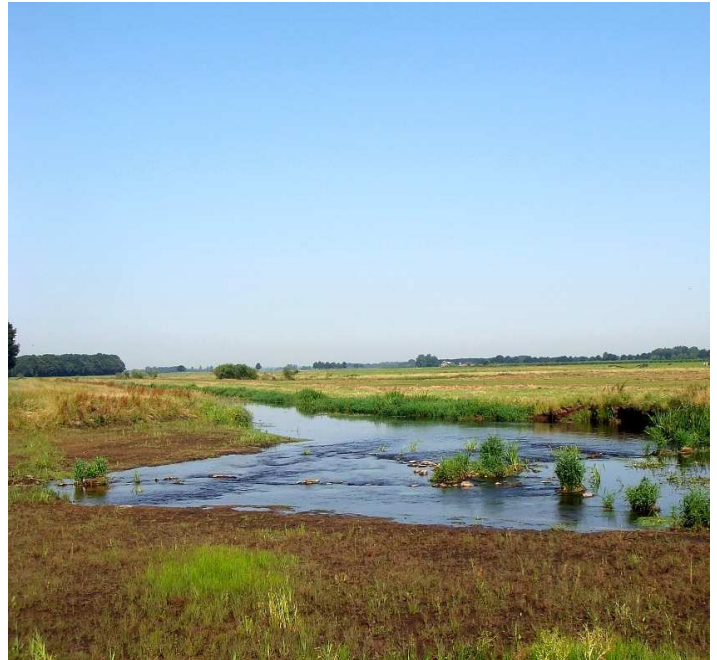
Hunze in de Elzemaat

Het kerkje op de hoek werd in 1924 door Vereniging van Vrijzinnig Hervormden gebouwd. In het dorp heet het het Kleine Kerkje. Sinds een aantal jaren is het eigendom van de aan Het Drentse Landschap gelieerde Stichting Oude Drentse Kerken. In 2008 werd het Kleine Kerkje gerestaureerd en geschikt gemaakt voor culturele activiteiten.