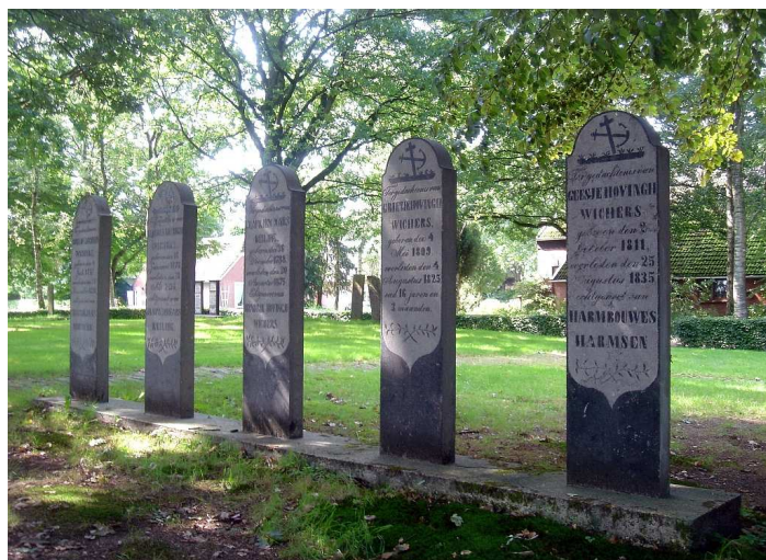
Schippersgraven oude kerkhofje Gasselternijveen

Aan de oostkant van de Hunze ligt een smalle zandrug die de Hunzelaagte scheidt van de enorme Drents-Groningse Veenkoloniën. Van Zuidlaarderveen in het noorden tot Exloërveen in het zuiden ligt over die rug een lang, kronkelend lint streekdorpen met een eeuwenoude geschiedenis. Ze werden als randveenontginning gesticht door bewoners van de Drentse Hondsrugdorpen. Aanvankelijk leefde men er van de turfwinning, later werd landbouw het hoofdmiddel van bestaan.