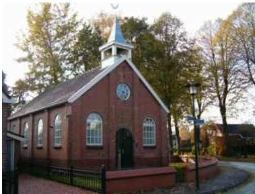
Kleine Kerkje Gieterveen

U rijdt een stukje langs de oude spoorbaan van de Noord Ooster Lokaal Spoorwegmaatschappij die in 1905 de verbinding tussen Assen en Stadskanaal ging verzorgen. De voormalige NOLS-halte Gasselte werd in 1970 afgebroken.