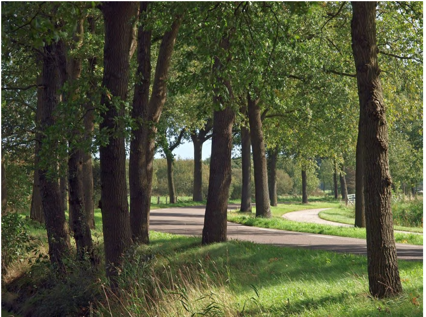
Fietspad ter hoogte van Huis Ter Hansouwe

Ga een dag fietsen en maak kennis met het Huis Ter Hansouwe en het landschap van de Peizer- en Eeldermeden. Onze routebeschrijving begint bij het huis Lemferdinge in Paterswolde waar u de auto prima kunt parkeren. Onderweg kunt u op elke plek beginnen. Bijvoorbeeld bij het station in Haren of gewoon vanuit huis als u bijvoorbeeld in de stad Groningen woont.