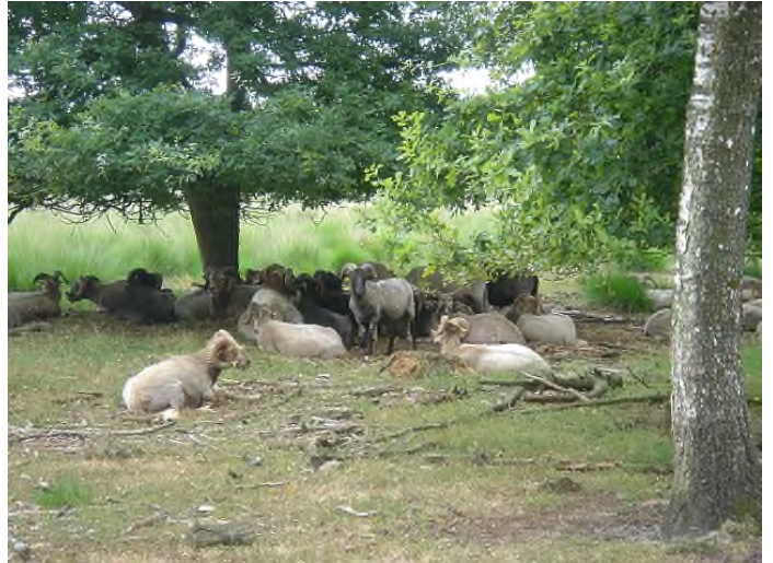
Bossen Schoonoord

U kunt hier even rechtsaf naar Schoonoord fietsen, het dorp dat in 1854 ontstond toen arbeiders die aan het kanaal werkten er hun plaggenhutten optrokken. Misschien is het zelfs een goede gelegenheid voor een bezoek aan Openluchtmuseum Ellert en Brammert, Tramstraat 73, 7848 BJ Schoonoord, www.ellertenbrammert.nl .