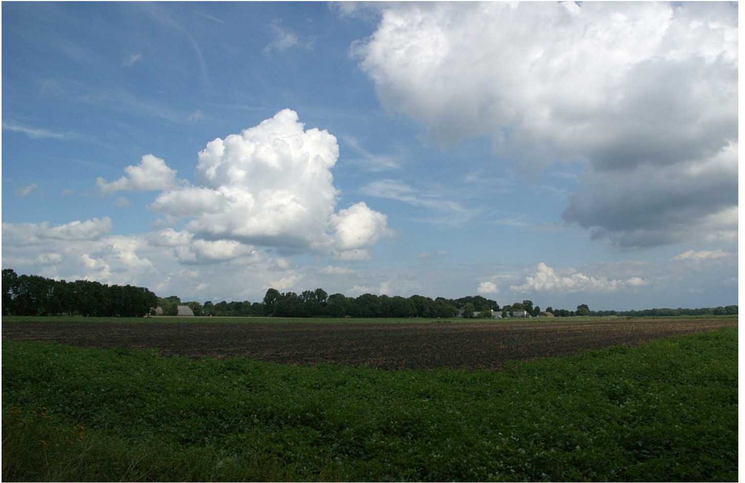
Es Wezup

De tocht begint in monumentendorp Orvelte en laat u onderweg kennismaken met vrijwel alle facetten van het Drentse esdorpenlandschap: de hoge essen rond de dorpen, de groenlanden langs de beken en het heideveld en de bossen die erop gedijden. U komt door de esdorpen Oud-Aalden, Benneveld en Noord-Sleen. De tocht voert u terug naar vroeger tijden: naar de gewijde plaatsen van de hunebedbouwers, naar de Galgenberg, eenzaam op de hei, naar de gravers van het Oranjekanaal en naar het boerenleven in een Drents dorp honderd jaar geleden.