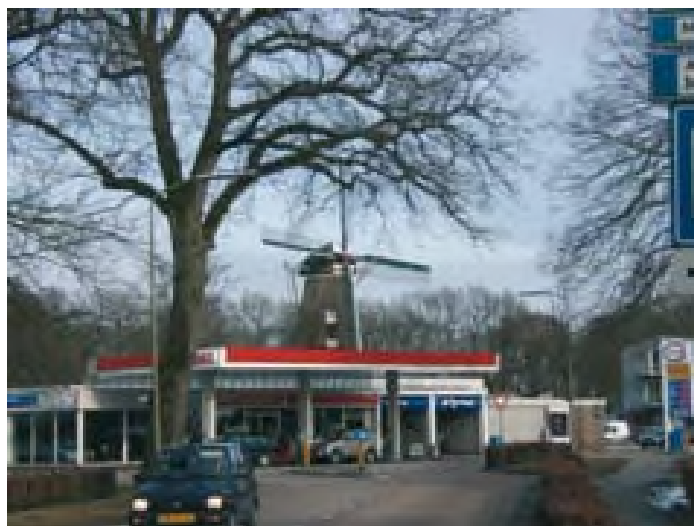
Oud en nieuw centrum Norg

De huizen aan de linkerkant aan het begin van het dorp zijn niet opvallend fraai vormgegeven. Gewoon een rij gewone huizen. Bijna achteloos stuk voor stuk neergezet en toch... ze passen hier perfect. Aangekomen bij het Westeind is deze harmonie volledig zoek. Een benzinestation onttrekt het grootste deel van de molen aan het gezicht. Er is een 'blikken' nieuwbouwcomplex waar je niet omheen kunt en overal staan winkelpanden die om uw aandacht schreeuwen.