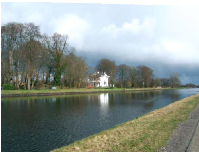
Villa Bosch en Vaart, Vries