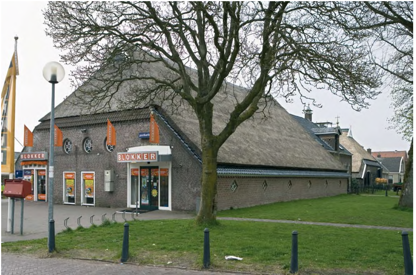
Winkel in oude boerderij in Norg