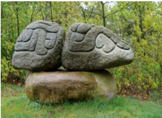
Mental Map

U passeert het beeld Mental Map van Petra Boshart. Haar beeld is het omgekeerde van het hunebed: hier worden twee kleinere zwerfstenen gedragen door één grote zwerfkei. De tekeningen lijken door een oude verdwenen cultuur op de stenen zijn aangebracht. Het kunstwerk maakt deel uit van het zwerfstenenproject 'Grenzen en Ontmoetingen' in de gemeente Borger-Odoorn. Het telt in totaal zes van dergelijke beelden. Het Drentse Landschap heeft zich indertijd over het project ontfermd.