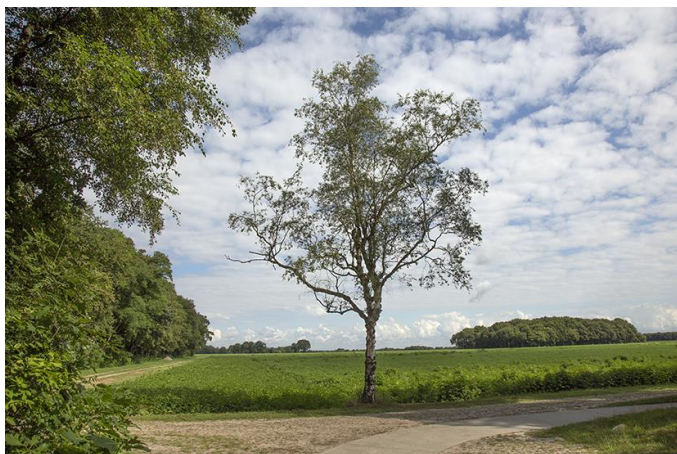
Exloër Zuideresch

De Hunzeloop, een jaarlijks wandelevenement om de Hunzevallei te promoten, wordt georganiseerd door Het Drentse Landschap, Het Groninger Landschap en De Friesland Zorgverzekeraar in nauwe samenwerking met de KBNLO, Zuidlaarder Ondernemers Vereniging en Recreatieondernemers Noordoost Drenthe. Zie voor meer informatie www.hunzeloop.nl .