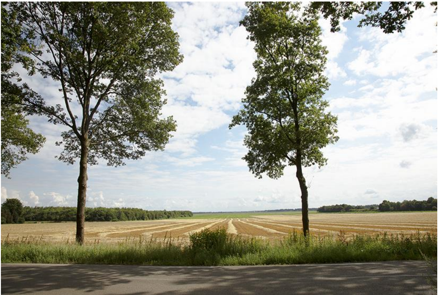
Zicht op de Zoersche landen

Vandaag is het tijd voor hoge luchten, weidse vergezichten en het gezang van de veldleeuwerik hoog in de lucht. Te beginnen op de uitgestrekte Zuideresch van Exloo. En verderop als u van de Hondsrug naar beneden loopt richting veen. Voorbij de kletsnatte natuur van de Kwabsche Kuilen komt u langs eindeloos lijkende veenkoloniale aardappelvelden.