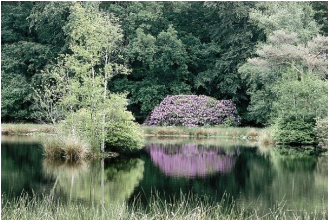
Rhododendrons bij de vijver

U loopt door wat men vroeger de Kwekerij noemde. Hier werden uit zaad allerlei boomsoorten gekweekt. Proefondervindelijk bepaalde men dan welke soorten het hier goed deden. Behalve eiken en beuken ziet u er fraaie exemplaren van Amerikaanse eik, fijnspar, douglasspar, zilverspar en schijnycypres. Het beheer van Het Drentse Landschap zorgt ervoor dat de bomenakker van weleer een bos wordt dat zich op een natuurlijke manier kan verjongen.