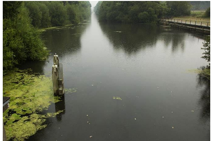
VAM kanaal

Achter het huis ligt de prehistorische grafheuvel die het landgoed zijn naam gaf. Stelt u zich de heuvel voor op een kaal heideveld zo ver het oog reikt en u begrijpt waarom men het in Wijster over de Vossenbergh had. De Vossenbergh was één van de vele grafheuvels in de buurt. De grafheuvels die hier onderzocht zijn, dateren van 2000 tot 1000 v.Chr.