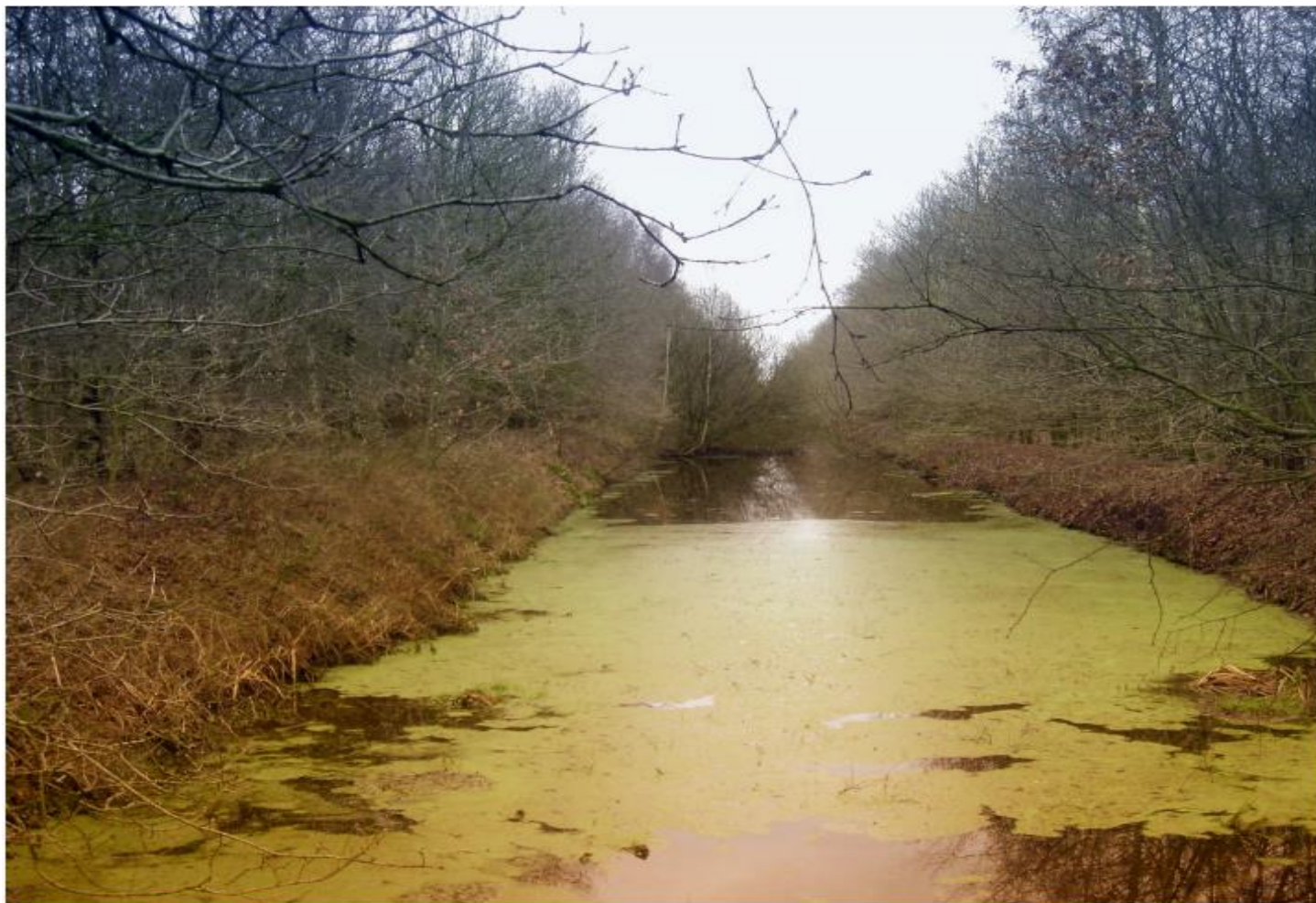
Wijk in Exloërkijl

Tussen Tweede Exloërmond en Valthermond ligt het 70 hectare grote bosgebied Exloërkijl. Wellicht verwacht u hier geen natuur, maar we beloven u dat u zult opkijken onderweg! U loopt langs bospaadjes, over graslandjes, langs de begroeiende oevers van de veenwijken en over zandkoppen. Regelmatig zeiden we tegen elkaar hoe onverwacht mooi dit gebiedje is. Exloërkijl is een interessant voorbeeld van de mogelijkheid om nieuwe natuur te ontwikkelen in gebieden waar je niet onmiddellijk aan natuurlijke schoonheid denkt.