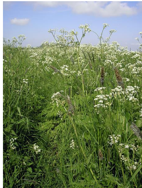
Fluitenkruid (foto Henny Leijtens)

Onderweg zult u nog steeds veel kunstmatigs in het bos tegenkomen. Op sommige plaatsen waant u zich op een in Engelse landschapsstijl aangelegde buitenplaats. Het Drentse Landschap is niet van plan nadrukkelijk in te grijpen in het gebied. De ervaring leert dat het bos zijn eigen gang gaat, zijn eigen richting en ritme kiest en zich daarbij bitter weinig van de mens aan trekt. Onderweg ziet u bomen die na dertig jaar niet veel verder gekomen zijn dan vuistdikke exemplaren. In dit stukje bos zullen na verloop van tijd veel bomen het loodje leggen waarna de natuur die soorten de kans geeft die zich hier beter op hun gemak voelen. Kenners van het bos zien in de spontane opslag van hulst een teken dat in Exloërkijl een meer natuurlijk bos aan het ontstaan is.