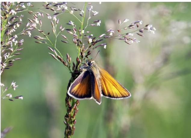
Kleine vuurvliinder

Het bosgebied Exloërkijl werd begin jaren zeventig door Staatsbosbeheer aangelegd als landschapselement rond een grote zandafgravingsplas. Deze waterpartij ontstond toen er grote hoeveelheden zand nodig waren voor het dempen van de kanalen in o.a. Tweede Exloërmond en Valthermond. Provincie en gemeenten kozen er destijds geestdriftig voor om vanwege de toenemende verkeersdruk tientallen kilometers kanaal in de Drents-Groningse Veenkoloniën te dempen. Monden en wijken veranderden in brede wegen waar het verkeer ongehinderd zijn gang mocht gaan. Karakteristieke veenkoloniale dorpen hebben in die tijd veel van hun oorspronkelijke karakter verloren.