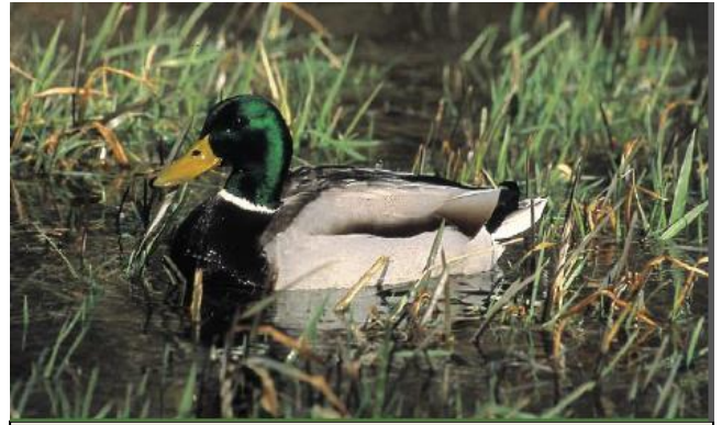
Mannetje wilde eend