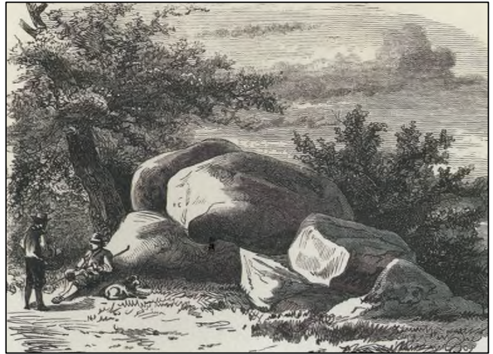
Achttiende-eeuwse prent Hunebed Rolde

De 'tweeling' hunebedden D17 en D18 van Rolde zijn waarschijnlijk de bekendste Drentse hunebedden. In 1905 stonden ze samen met de ruïne van Brederode en een paar musea als enige archeologische bezienswaardigheden van Nederland in de beroemde Baedeker-reisgids. Rond 1870 kwamen beide hunebedden voor een bedrag van in totaal 150 gulden in het bezit van het rijk.