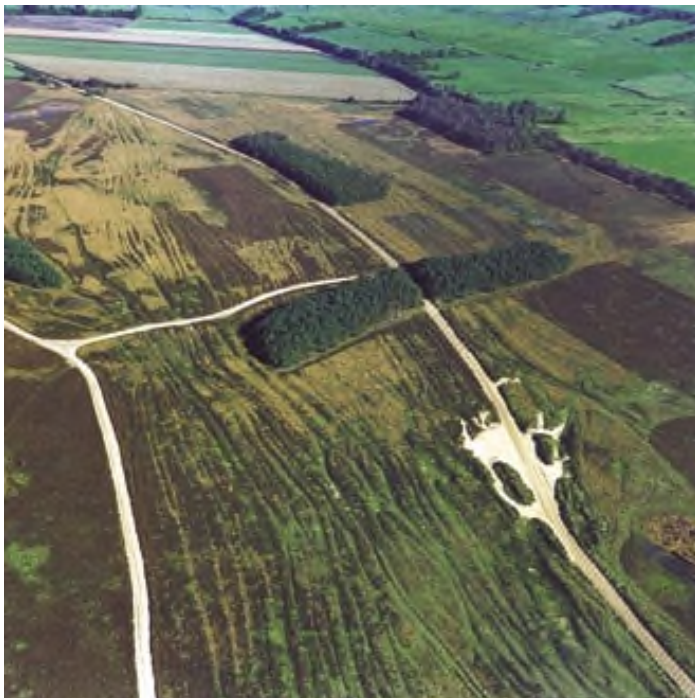
Middeleeuwse karrensporen op het Ballooërveld

Met zijn 370 hectare hoort het Ballooërveld tot de grotere Drentse natuurterreinen. De aanwijzing tot militair oefenterrein in 1918 zorgde ervoor dat het veld aan ontginning kon ontsnappen. Net als eerder op Kampsheide en in de Gasterse Duinen heeft ook het Ballooërveld een lange geschiedenis van menselijke activiteit. Er liggen meer dan veertig grafheuvels op het veld. De meeste ziet u aan het eind van het schelpenpad aan de zuidkant van het veld. De mensen gaven het vroeger de naam Mandenberg. De grafheuvels zijn in gebruik geweest tussen 2900 v.Chr. en het begin van de jaartelling. Ook zijn er urnenvelden en celtic fields aangetroffen. Net als door de Gasterse duinen lopen er ook duidelijk zichtbaar brede karrensporen over het Ballooërveld.