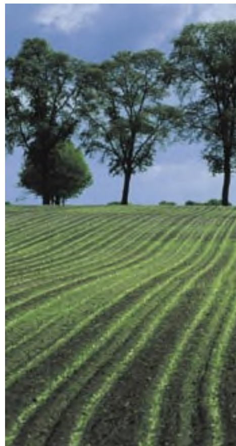
Ballooër esch

Hunebed D15 hoog op de Looner esch werd voor het eerst vermeld in de 'Landbeschrijvingh' van Arend van Slichtenhorst die het had over 'het reusen-bed bij 't Clooster van Assen'. Het bijzondere van dit hunebed is dat ook de ingangsstenen en de ring van kranstienen nog aanwezig zijn.