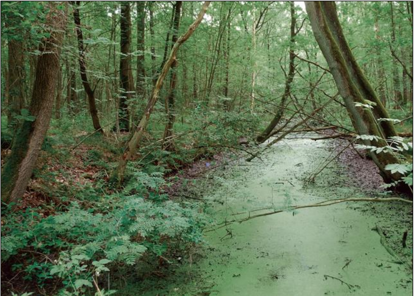
Veenwijk in het Hollandsche veld