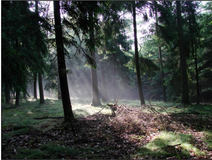
Ochtendstemming in het naaldbos

In dit deel van het bos zijn de percelen met sparren flink uitgedund. Wat verderop in het bos wordt de begroeiing veel gevarieerder. Dit stuk onderscheidt zich van het sparrenbos hiervoor door de aanwezigheid van eiken die minstens tachtig jaar oud zijn.