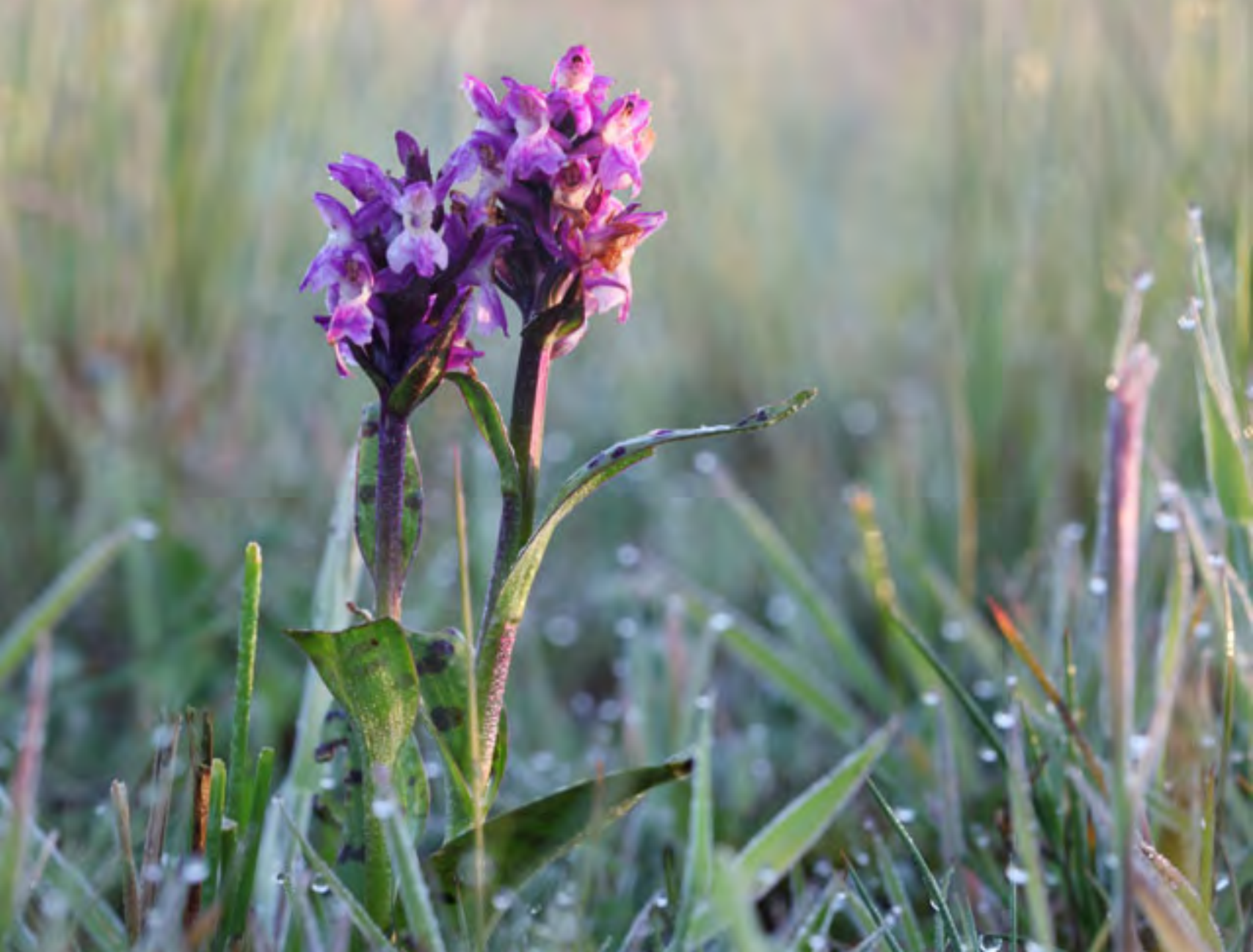
Breedbladige orchis

natuurgebied kreeg halverwege de jaren zestig vorm toen het door een ruilverkaveling verloren dreigde te gaan. Staatsbosbeheer heeft nu in het Drentsche Aa-gebied meer dan 2000 hectare in eigendom verworven. Door consequente vershraling zijn langs de beek prachtige blauwgraslanden ontstaan met orchideeën, echte koekoeksbloem en ratelaar. Meer dan de helft van alle in Nederland voorkomende plantensoorten zijn hier aangetroffen! Het zal moeite kosten om ergens anders in Nederland een plek te vinden waar dat ook zo is. In juni zijn de bloemrijke hooilanden op hun allermooist.