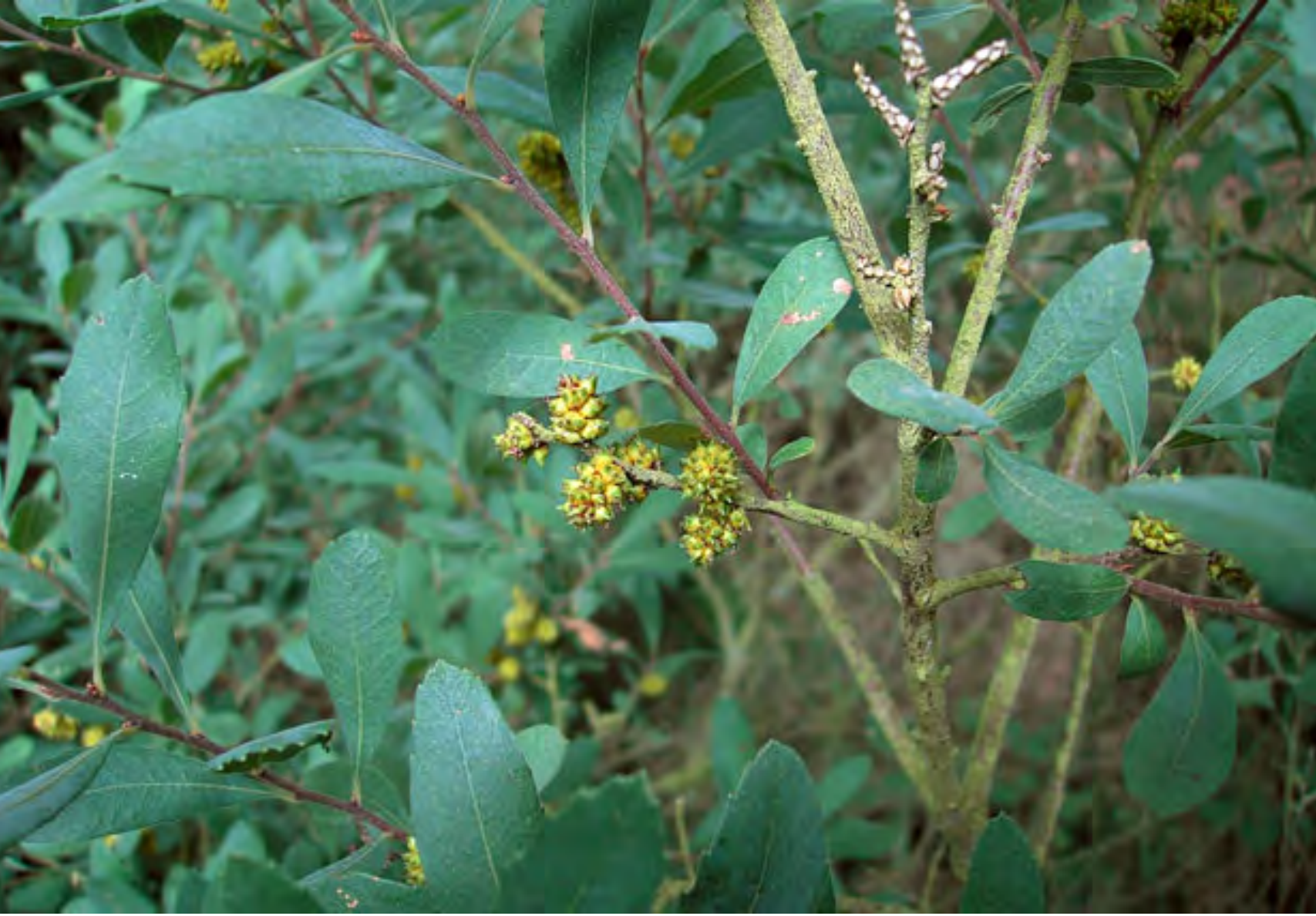
Gagel in bloei