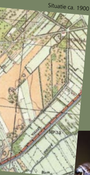
Situatie ca. 1900

3 Vóór het wildrooster volgt u rechtsaf het paadje langs het raster. Misschien echter moet u hier eerst even via het rooster het veld verlaten. Voorbij de boerderij ligt in het bos in de bocht van het bospad links tussen de bomen het Eupen Barchien. Daarna gaat u terug en vervolgt u de route langs het raster. Aan het eind van het veld maakt het pad een haakse bocht.