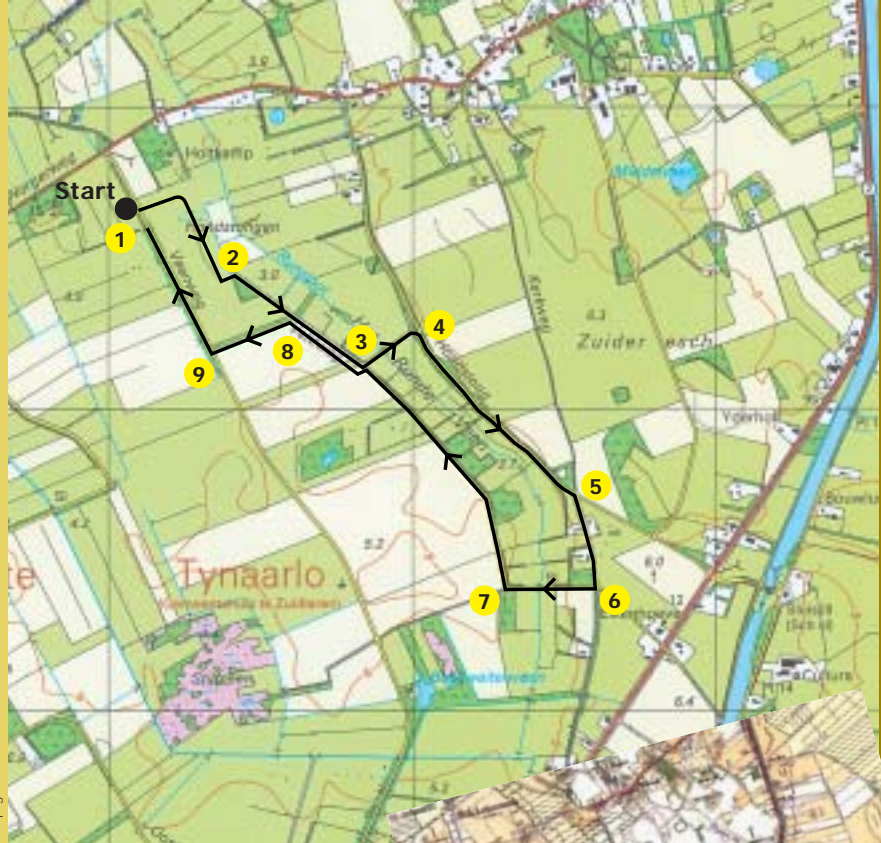
No. 12B Vries

Een eeuwenoud zandpad volgt de grens van het voormalige grote heideveld en het beekdal van de Runslot. U ziet twee soorten houtwallen: walletjes die dwars op de beek staan en het groenland in kleine kampjes verdelen, en de zogeheten grenswal langs het pad die de grens tussen het groenland en het voormalige heideveld vormt. Al deze wallen functioneerden vroeger voornamelijk als veekering. Dat de wal langs het pad erg oud is, bewijzen planten als