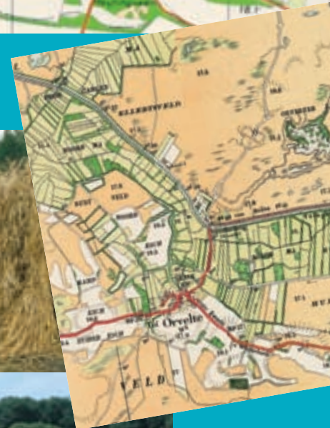
Situatie rond 1900