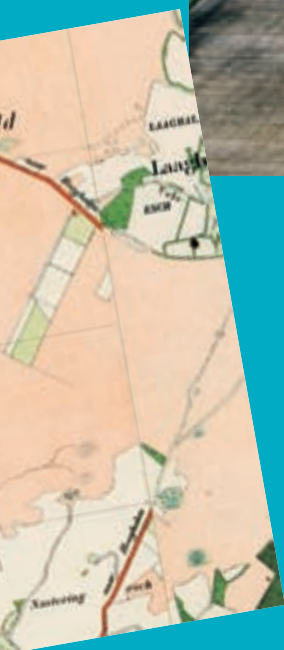
Situatie rond 1895