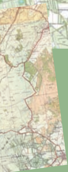
Situatie circa 1905